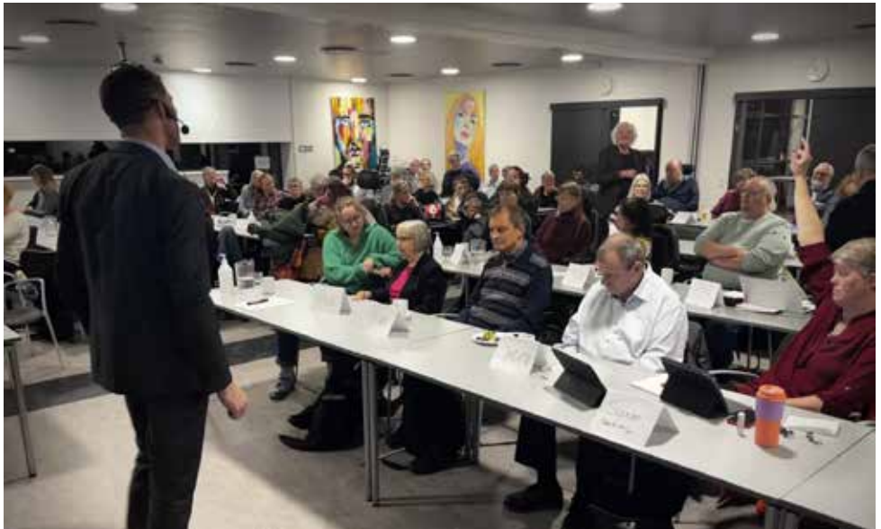
Rådmanden kommunikerede tillidsfuldt til ca. 70 fremmødte.