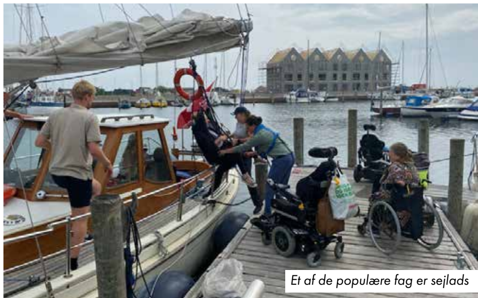
Et af de populære fag er sejlads