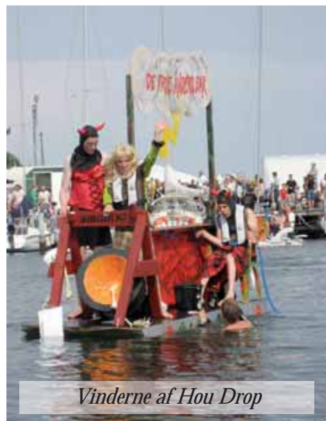
Vinderne af Hou Drop